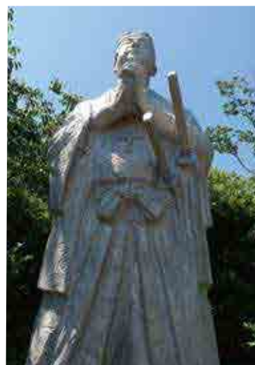
世界文化遺産 「長崎と天草地方の潜伏キリシタン関連遺産」 島原の乱最後の舞台「原城跡」

めんの山一の手延べ麺は全て厚生労働省認定の単一等級製麺技能士を取得した麺匠が心を込めて作っております。