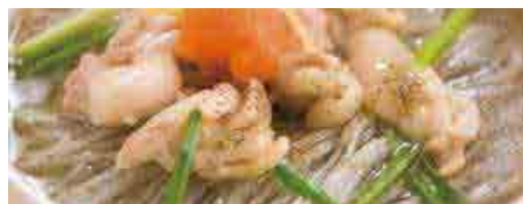
手延べ黒ごま麺 調理例