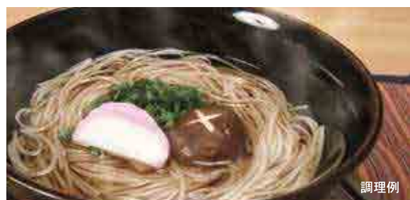
手延べそば 調理例

そばは挽き立て、打ち立てがいいと言われますが、まさに挽き立てのそば粉を使用し、乾麺でありながら、風味とそば特有の歯切れ感を大事に製造しました。